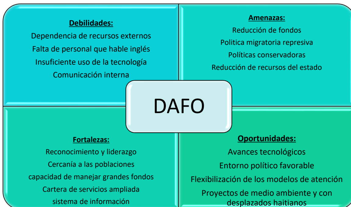
Figura 2: Resumen del Análisis DAFO

La flexibilización de los modelos de atención puede permitir el establecimiento de SAIs satélite y la expansión de modelos comunitarios de atención, donde COIN tiene gran fortaleza.